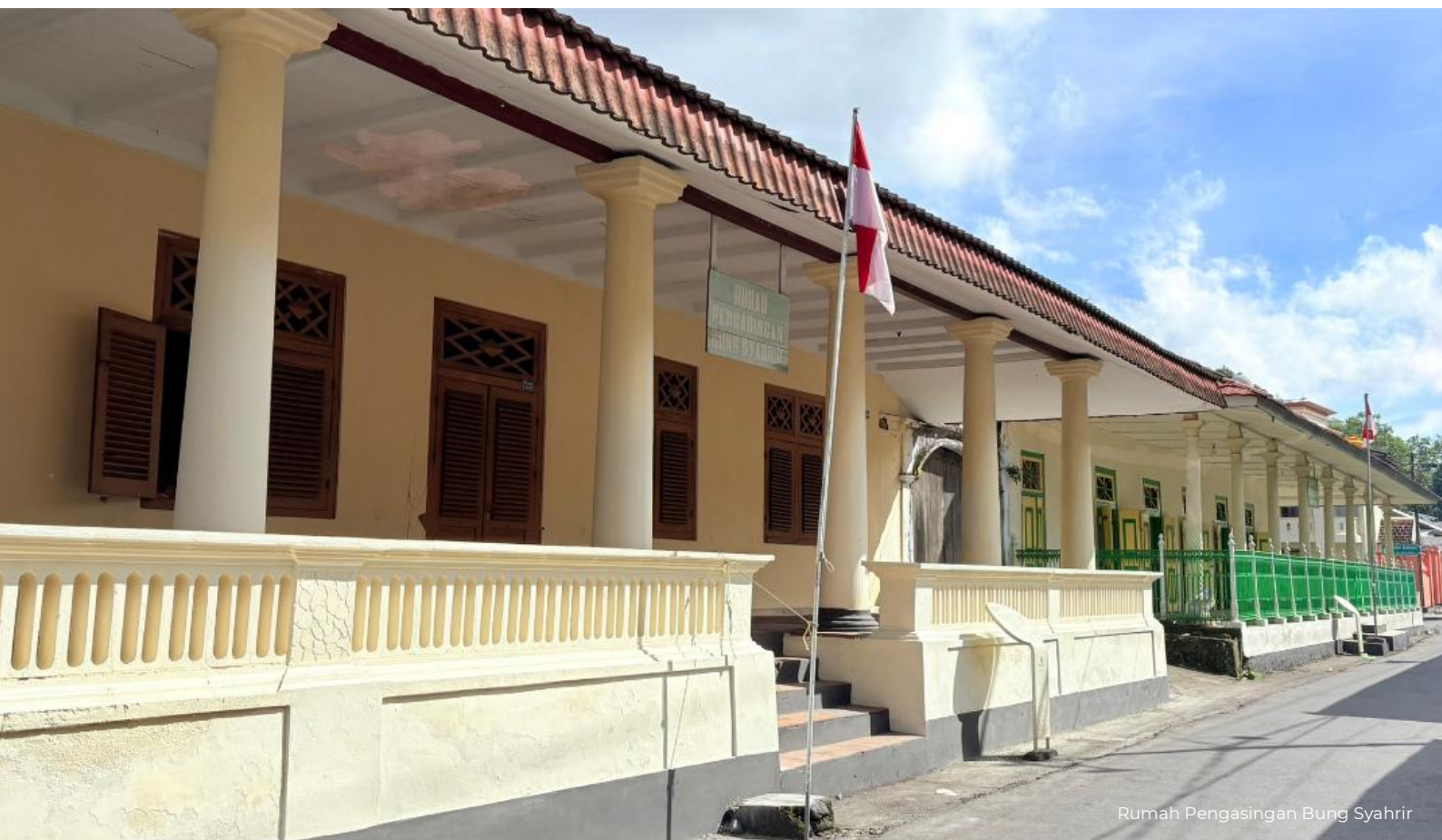
Rumah Pengasingan Bung Syahrir

"Jangan mati, sebelum ke Banda Neira." Itulah ungkapan tersohor seorang tokoh pendiri bangsa, Sultan Sjahrir. Kutipan itu merefleksikan keindahan alam Banda Neira yang menawan. Gugusan kepulauan dengan gunung api yang megah, alam bawah laut yang semarak, dan artefak peninggalan sejarah yang menjadi perawat ingatan. Banda Neira adalah sebenar-benarnya surga dari timur Indonesia.